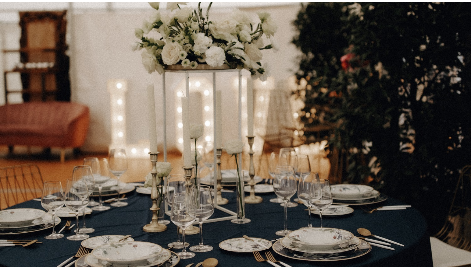
Festliche Tafel mit Rosenthal Turandot