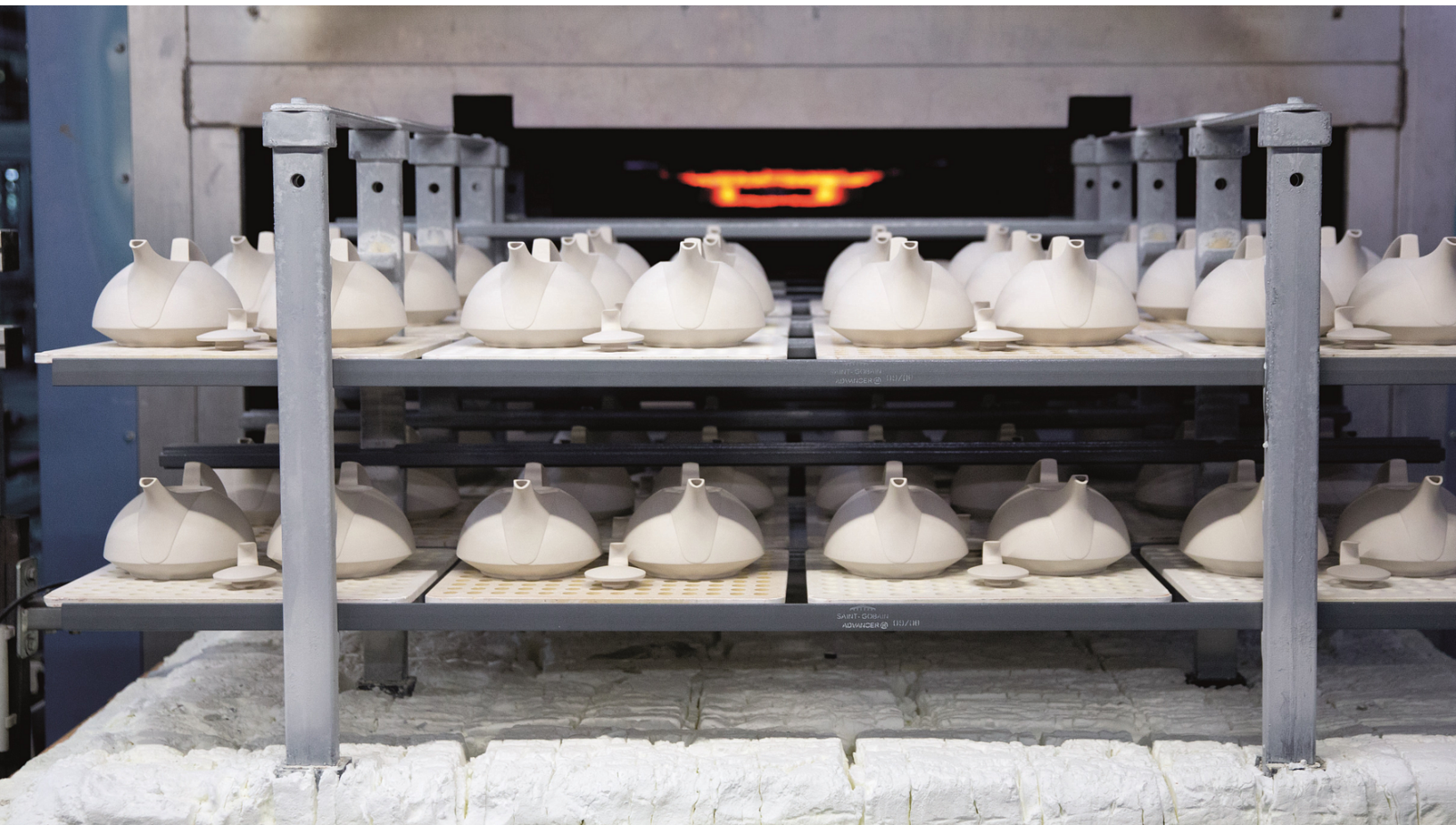
Blick in einen Brennofen im Werk Rosenthal am Rothbühl.