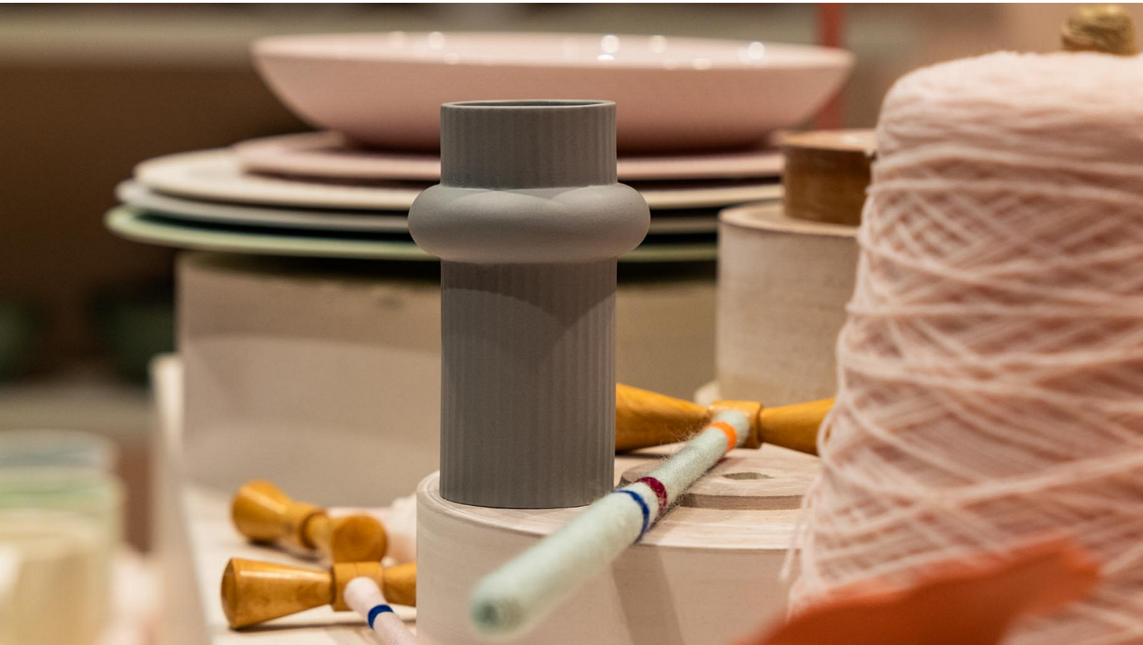
Werkzeuge aus der Fertigung bei der Präsentation der Designvasen