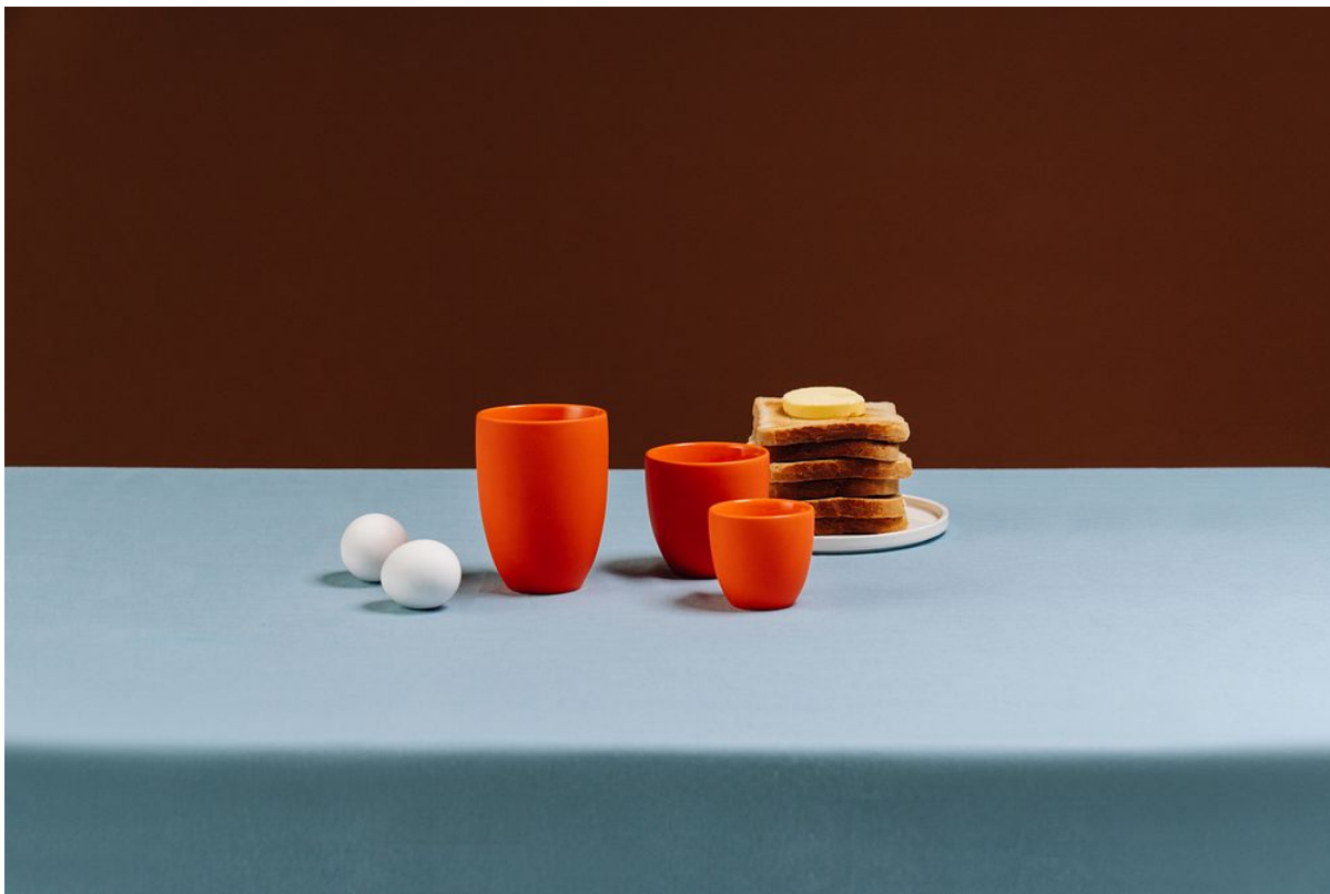
The Mug+ in der neuen Farbe Juicy Tangerine