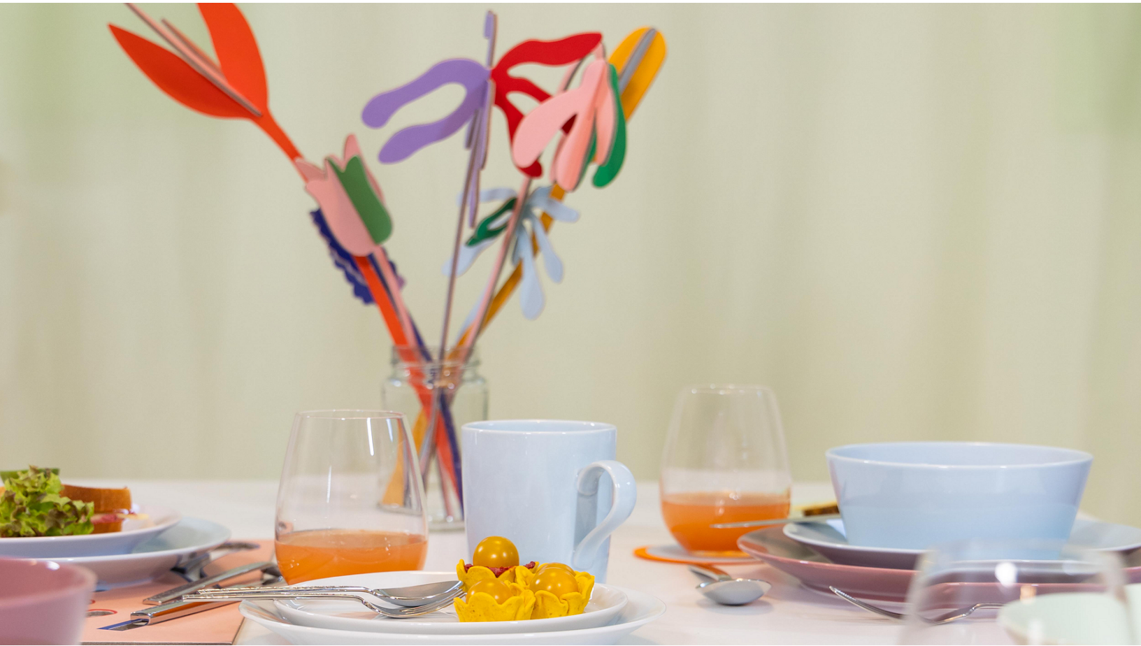
Thomas Kollektion Tric in neuen pastelligen Farben