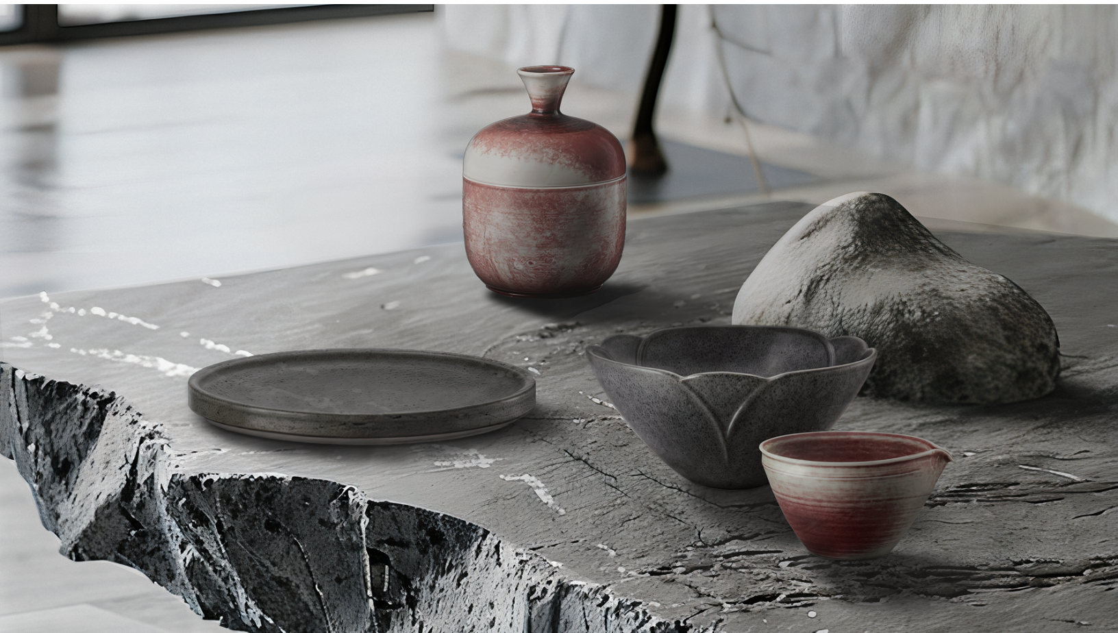
KI-generiertes Bild der Kollektion Bloom by Sara Farina