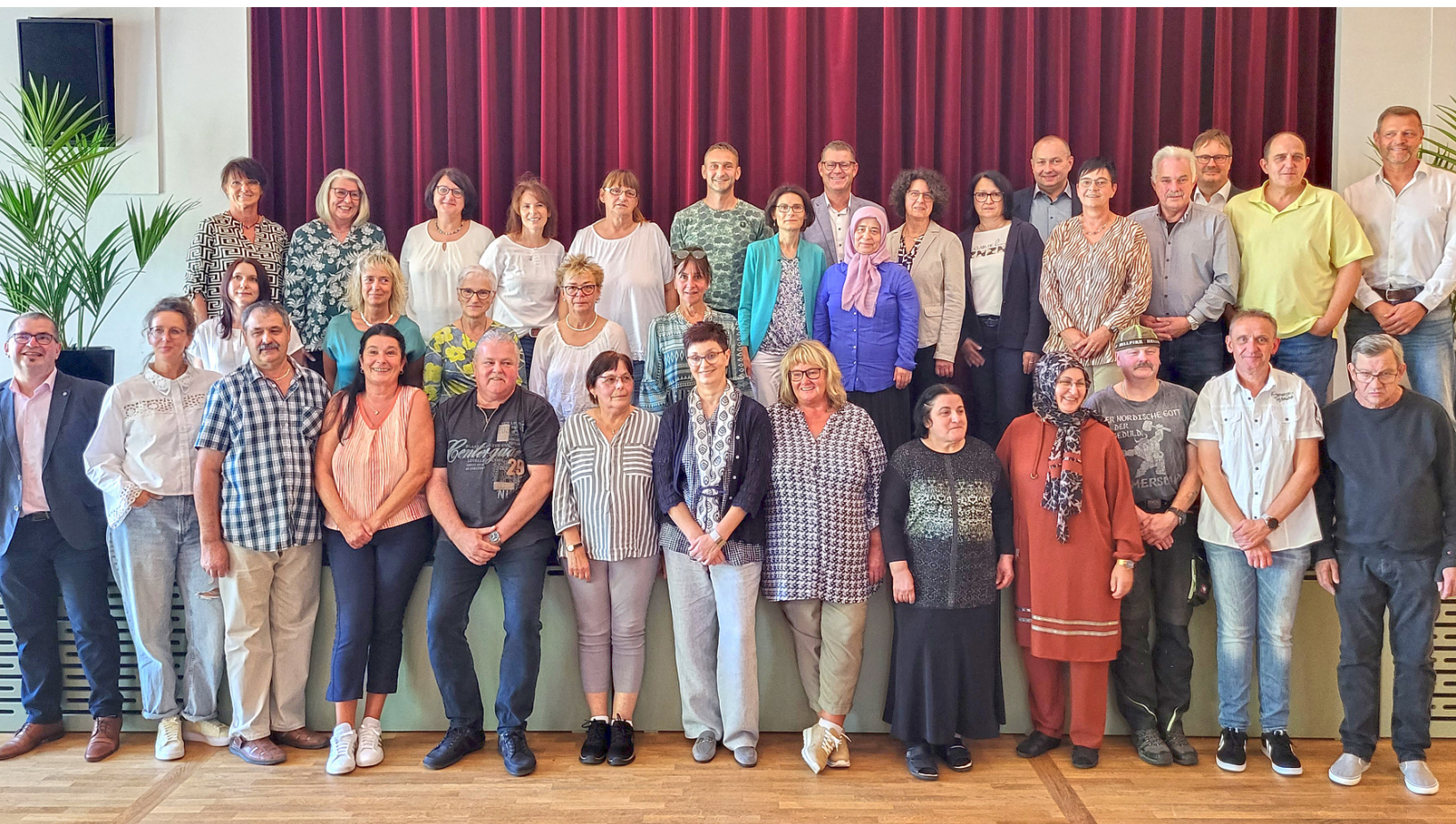
Die langjährigen Mitarbeiterinnen und Mitarbeiter der Firma Rosenthal.