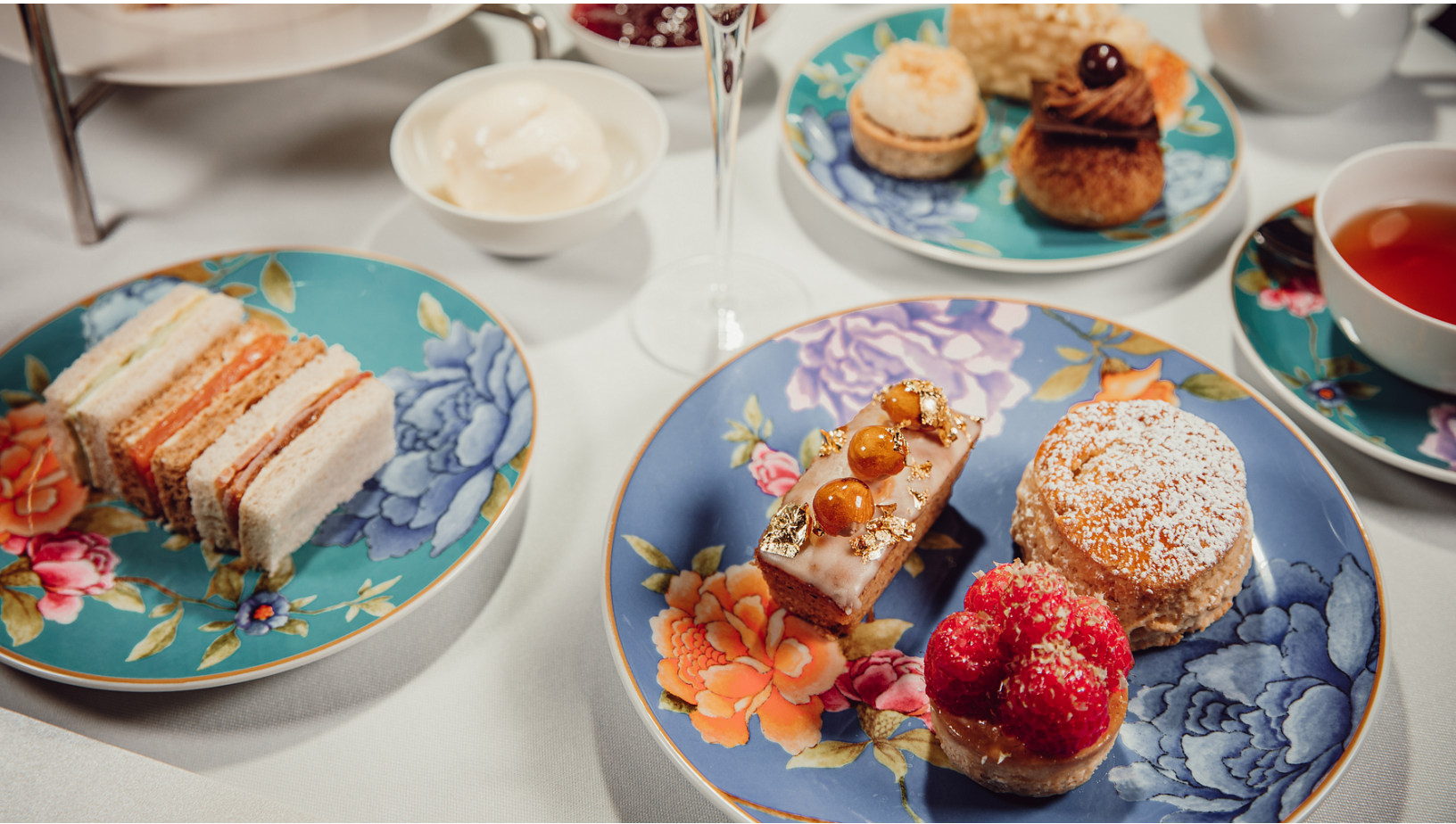
Rosenthals Sonderkollektion für den Althoff High Tea