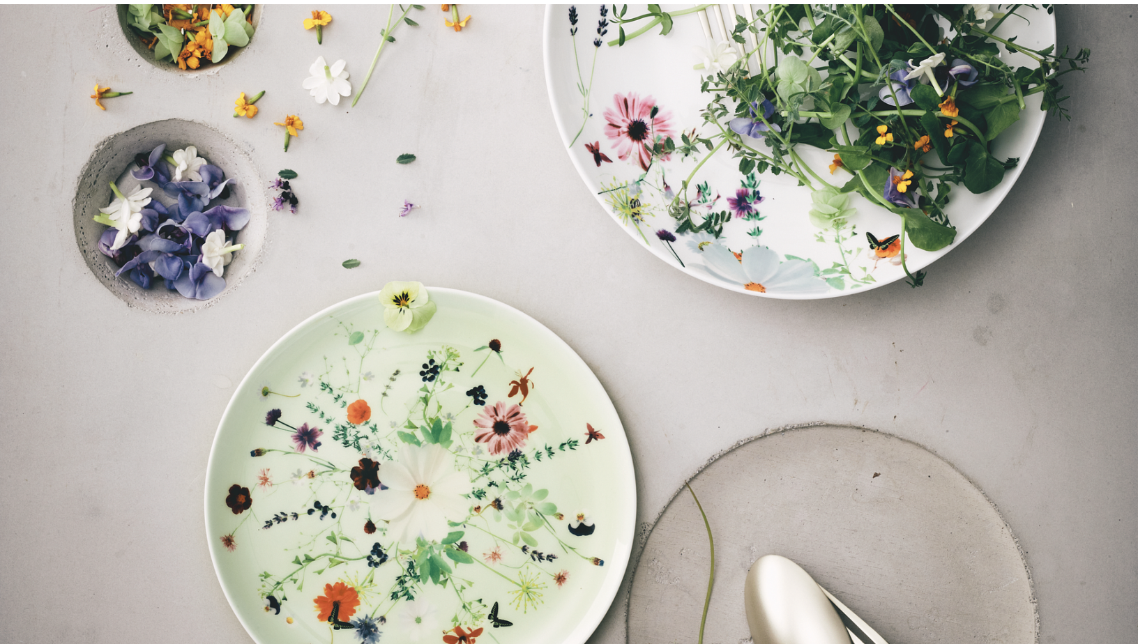
Rosenthal Brillance Grand Air