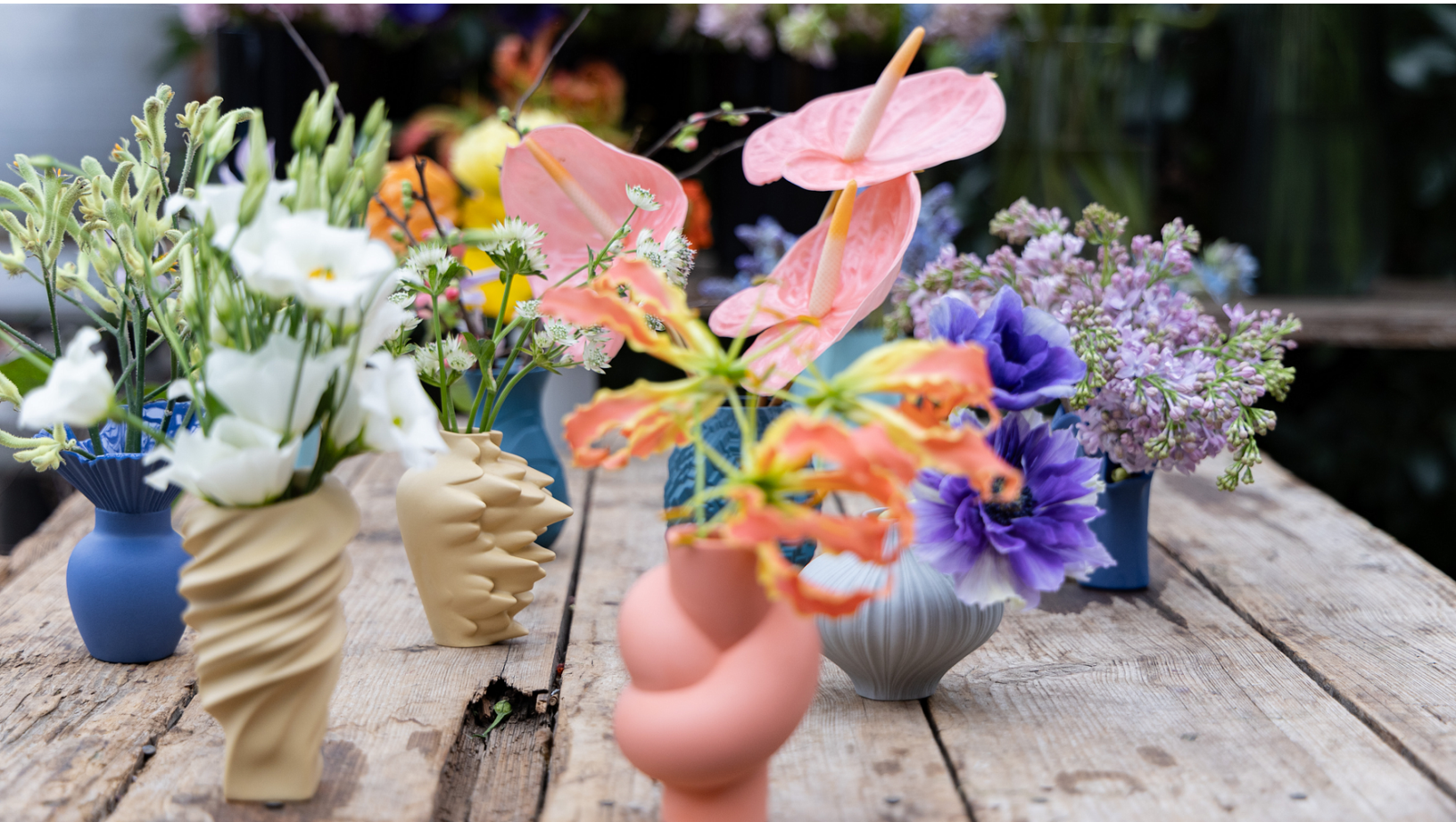
Rosenthal Mini Vases+