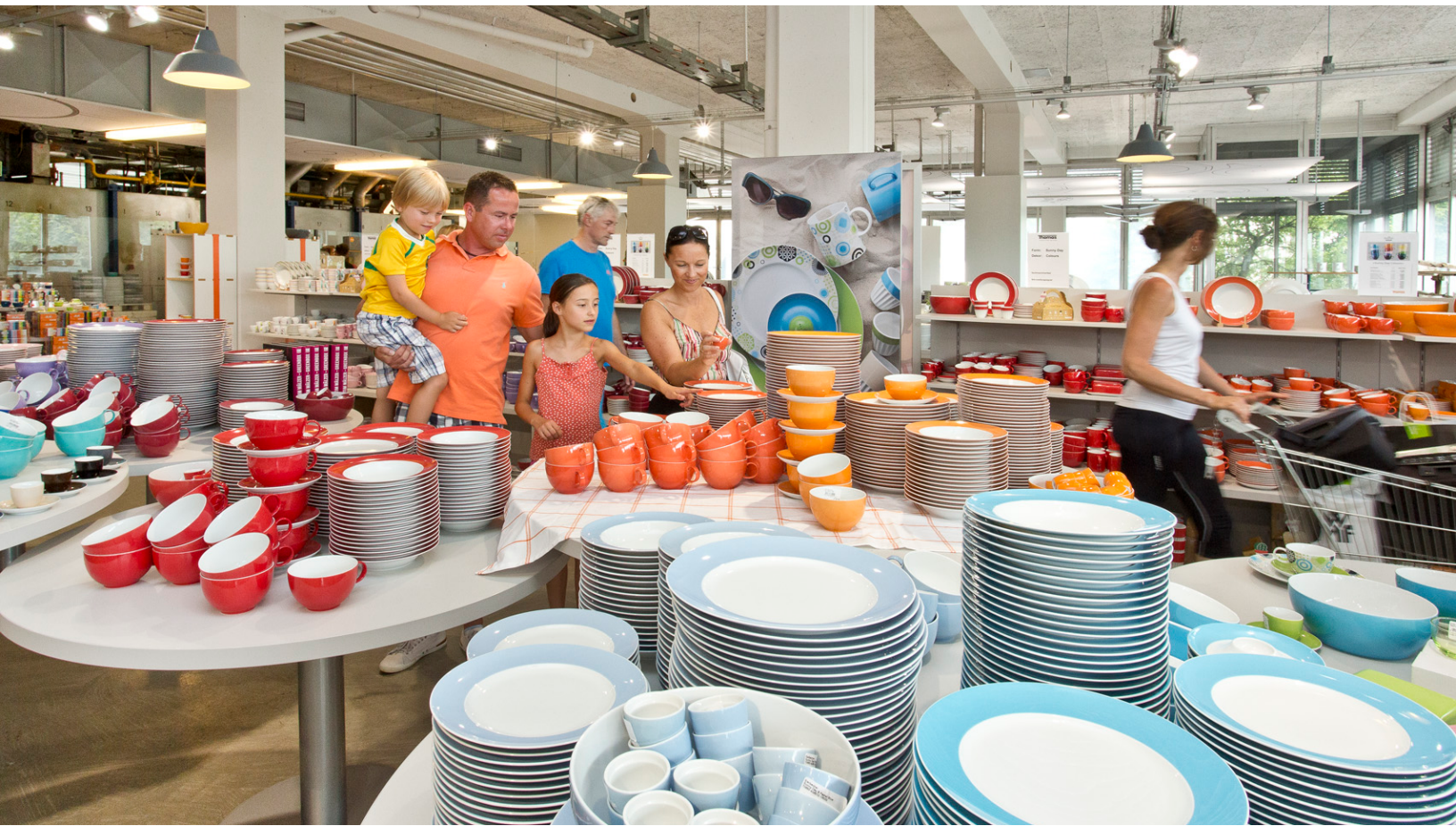
Rosenthal Outlet Center beim Porzellinerfest