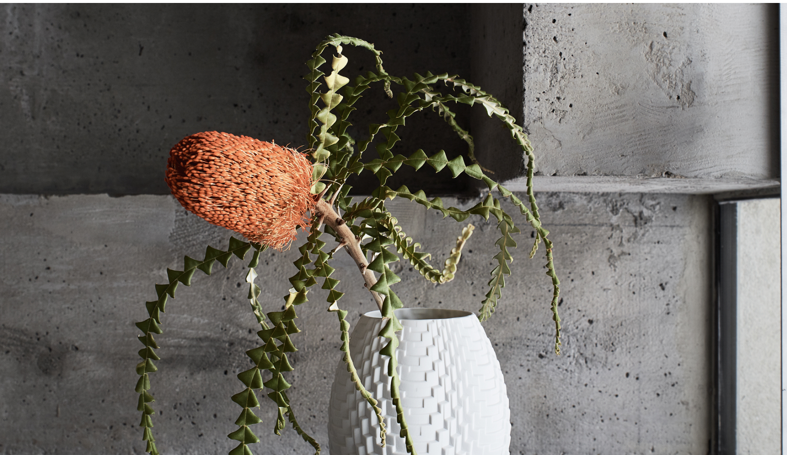
Dreidimensionale Transformation: Vase Manhattan aus der Rosenthal Kollektion Phi.