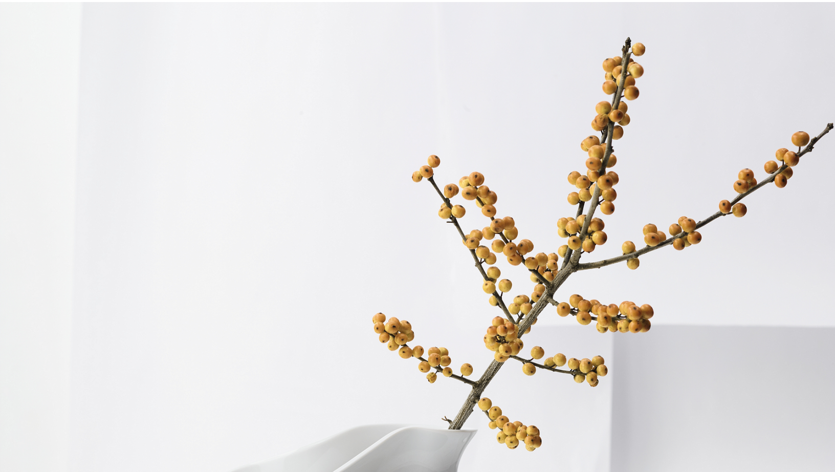
Rosenthal Vase La Chute.